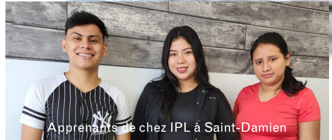
Apprenants de chez IPL à Saint-Damien